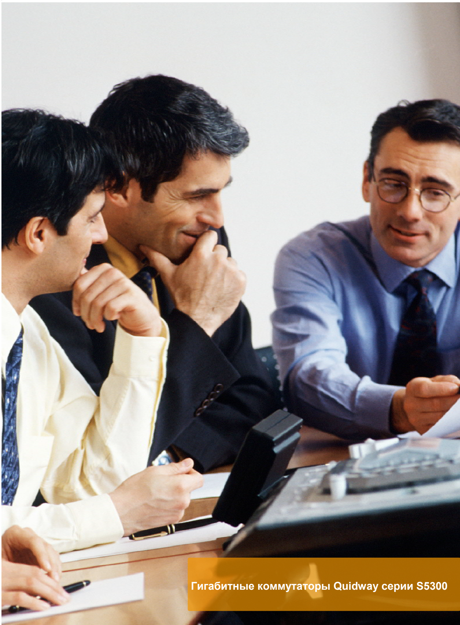
Гигабитные коммутаторы Quidway серии S5300